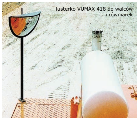
lusterko VUMAX 418 do walców i równiarek